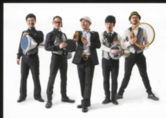
タブラクワイエサ from Tokyo