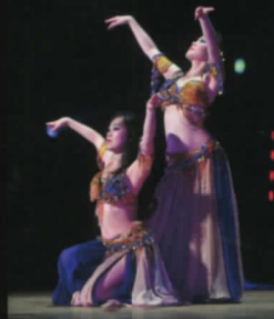
ミモザツインズ大分(ハル&リョウ)