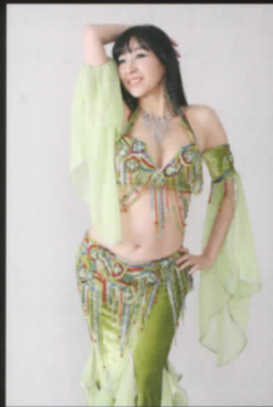
MAHA from Tokyo