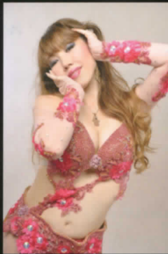
momoi from Fukuoka