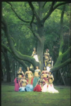
キャラバンカーニバル from Miyazaki