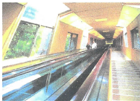
スペースウォーカー (山上館へのエスカレーター)